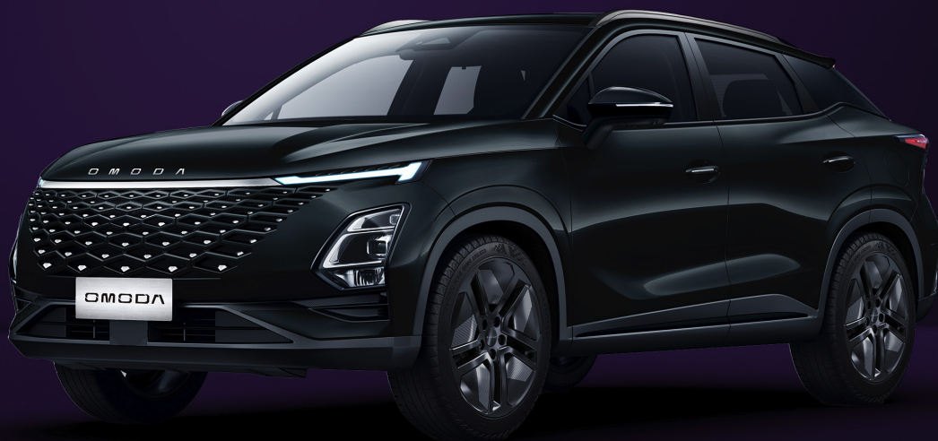
UHLÍKOVĚ ČERNÝ KRYSTAL (CLO)