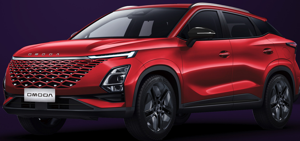
KRVAVĚ ČERVENÁ (NLO)