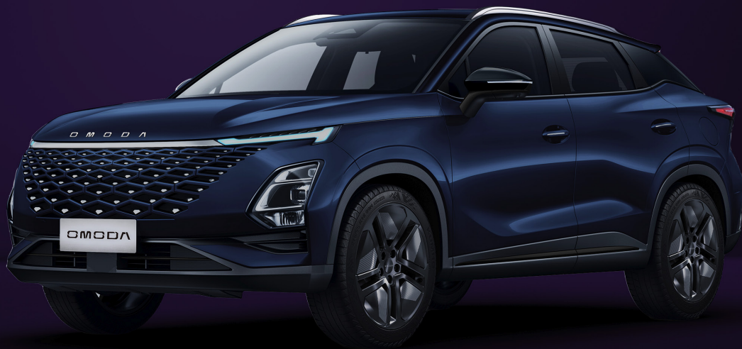
NOČNÍ MODRÁ (WB0)