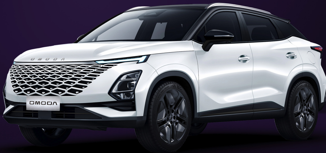
UHLÍKOVĚ ČERNÁ A KHAKI BÍLÁ (ZE0)