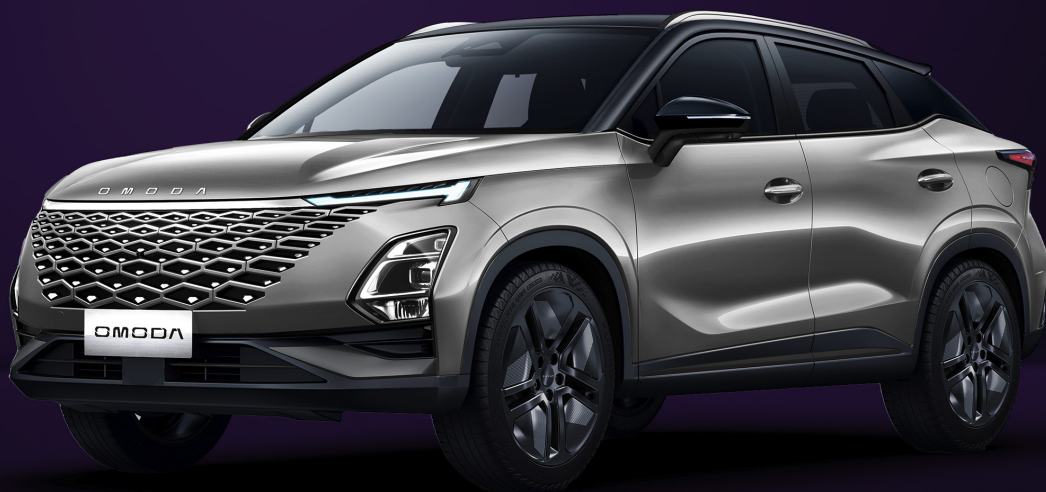
UHLÍKOVĚ ČERNÁ A KOVOVĚ STŘÍBRNÁ (X40)