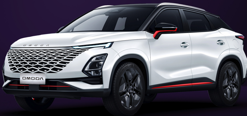
UHLÍKOVĚ ČERNÁ A KHAKI BÍLÁ RED TRIM (ZE1)