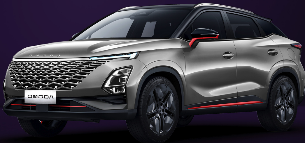
UHLÍKOVĚ ČERNÁ A KOVOVĚ STŘÍBRNÁ RED TRIM (X41)