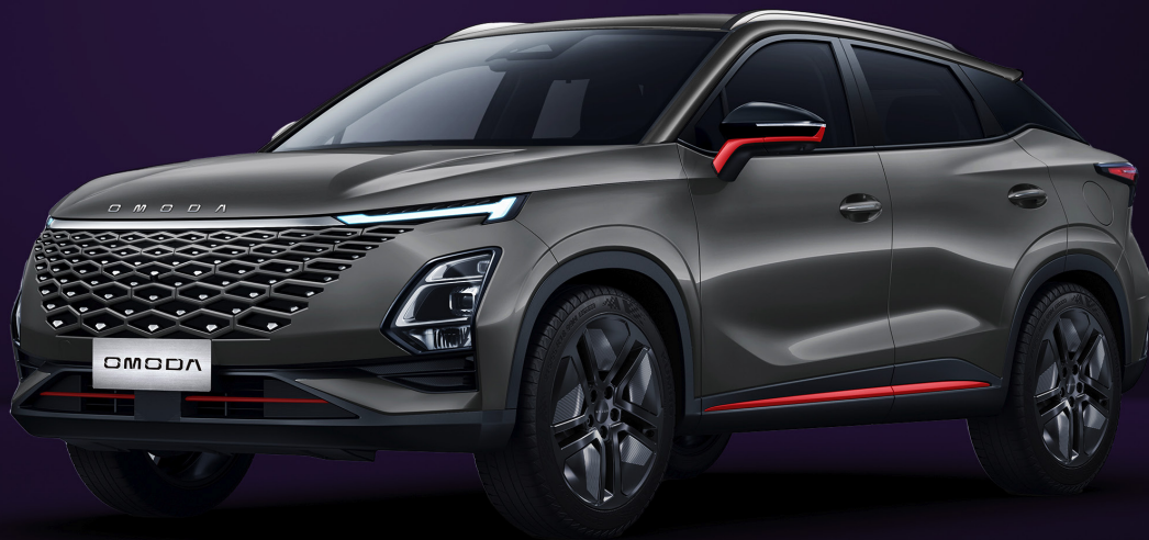
FANTOMOVĚ ŠEDÁ RED TRIM (GV1)