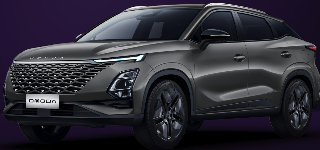
FANTOMOVĚ ŠEDÁ (GV0)