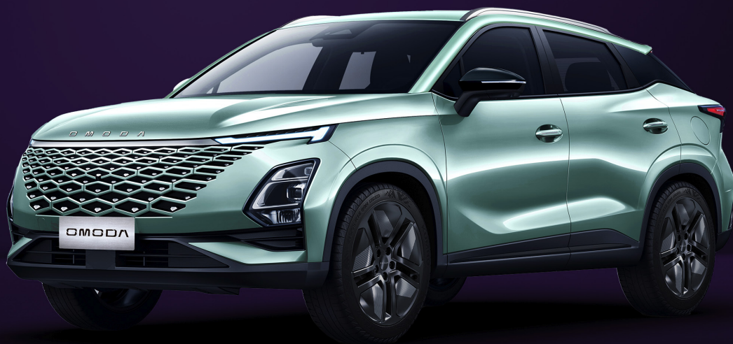
VODNÍ ZELENÁ (SK0)